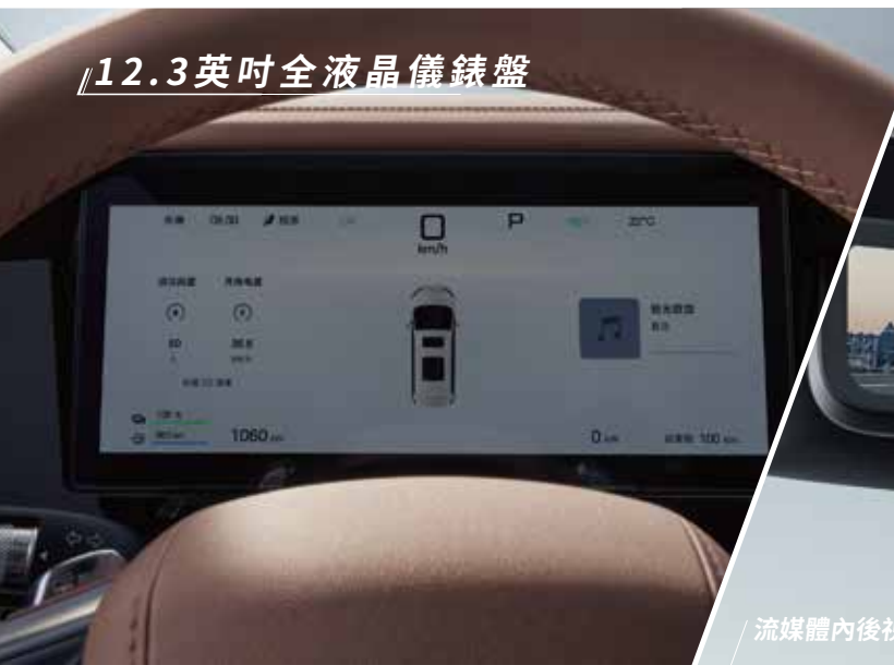
12.3英寸全液晶儀錶盤